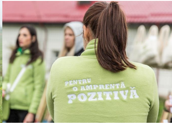
20 aprilie 2017 Echipele Yves Rocher au plantat la Videle